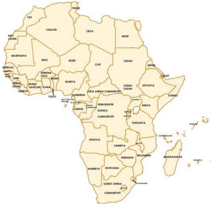
Resim 1: Afrika Kıtası

Çoğumuz farkında olmasak da, geride kalan on senelik süreçte Afrika'ya büyük yatırımlar yapan Çin yönetimi, bir bakıma Batı'nın kıta üzerinde asırlardır süren hakimiyetini belirgin biçimde sonlandırdı. Bunun kökleri aslında biraz daha geriye gidiyor. Belki de dönüm noktası olarak 1996'da Çin devlet başkanı Jiang Zemin'in 6 Afrika ülkesini ziyaret etmesi sayılabilir. Etiyopya'nın başkentinde bulunan Afrika Birliği merkezinde yaptığı konuşmasında Zemin, Çin-Afrika İşbirliği Forumu'nun (FOCAC) kurulmasını teklif etmişti. Bu, tarihi gelişmelerin ilk önemli adımı olarak kayda geçti. Zemin Çin'e döndükten sonra iş dünyasına hitaben yaptığı ilk konuşmada Çin şirketlerinin yeni iş kolları geliştirmek üzere yurtdışına açılmaları gerektiği konusunda açık bir çağrı yaptı. Daha önce hiçbir Çinli lider böyle bir istekte bulunmamıştı ve ana hedef en başından Afrika olarak gösterilmişti. Zemin'in önyak olduğu forum, Pekin'de 53 Afrika liderinin katılımıyla ilk defa 2002'de gerçekleşti. Zirvede Çin yönetimi kıtaya aktardığı kalkınma yardımlarını iki katına çıkarmayı, 5 milyar dolarlık bir Afrika kalkınma fonu oluşturmayı, mevcut borçların tamamını silmeyi, Etiyopya'da yeni bir Afrika Birliği genel merkezi inşa etmeyi, kıta genelinde 5 adet "ticaret ve işbirliği" bölgesi kurmayı, 30 yeni hastane, kırsal bölgelerde 100 yeni okul inşa etmeyi ve 15 bin Afrikalı profesyoneli eğitmeyi taahhüt etti.